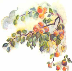
РИСУНКИ М. ГОРНЯКА